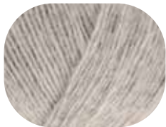
hellgrau meliert 00090