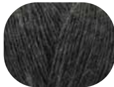
anthrazit meliert 00095