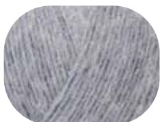
hellblau meliert 00050