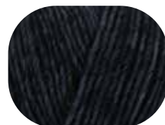
nachtblau meliert 00055