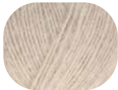
natur meliert 00002