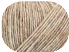
camel meliert 00020