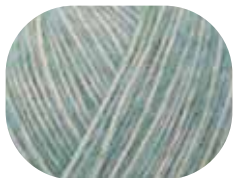
mint meliert 00062