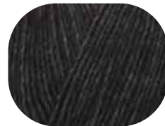
schwarz meliert 00099