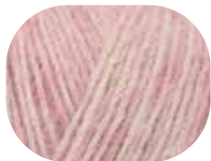
rosé meliert 00030