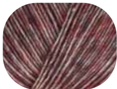
berry meliert 00084